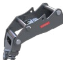
Adapter für pendelnde Geräte