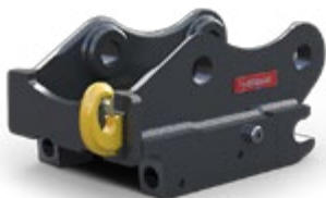
OilQuick Schnellwechsler mit Elektro- und Hydraulikkupplungen